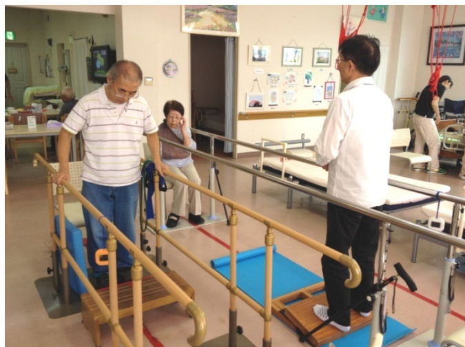
平行棒内リハビリ

筋力強化や柔軟性の向上など目的としてお客様に合わせながら最大約1時間の運動をします。