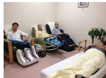
リラクセーション

手足のマッサージなどを行います。また1ヶ月に1回は専属スタッフのマッサージ(写真左)があります。