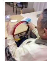
学習訓練・上肢リハビリ

簡単な計算やぬり絵で脳の活性化を図ります(写真左)。手や指などが動かしにくい方へは、ストレッチや手指の運動を提供しています(写真中央、右)